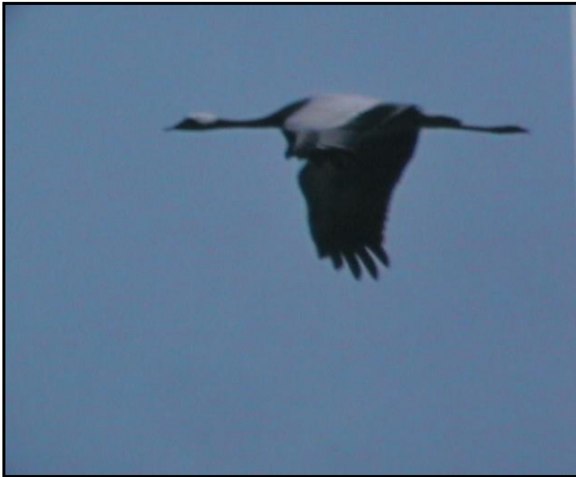
Журавль - красавка