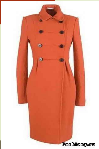
A coat cap